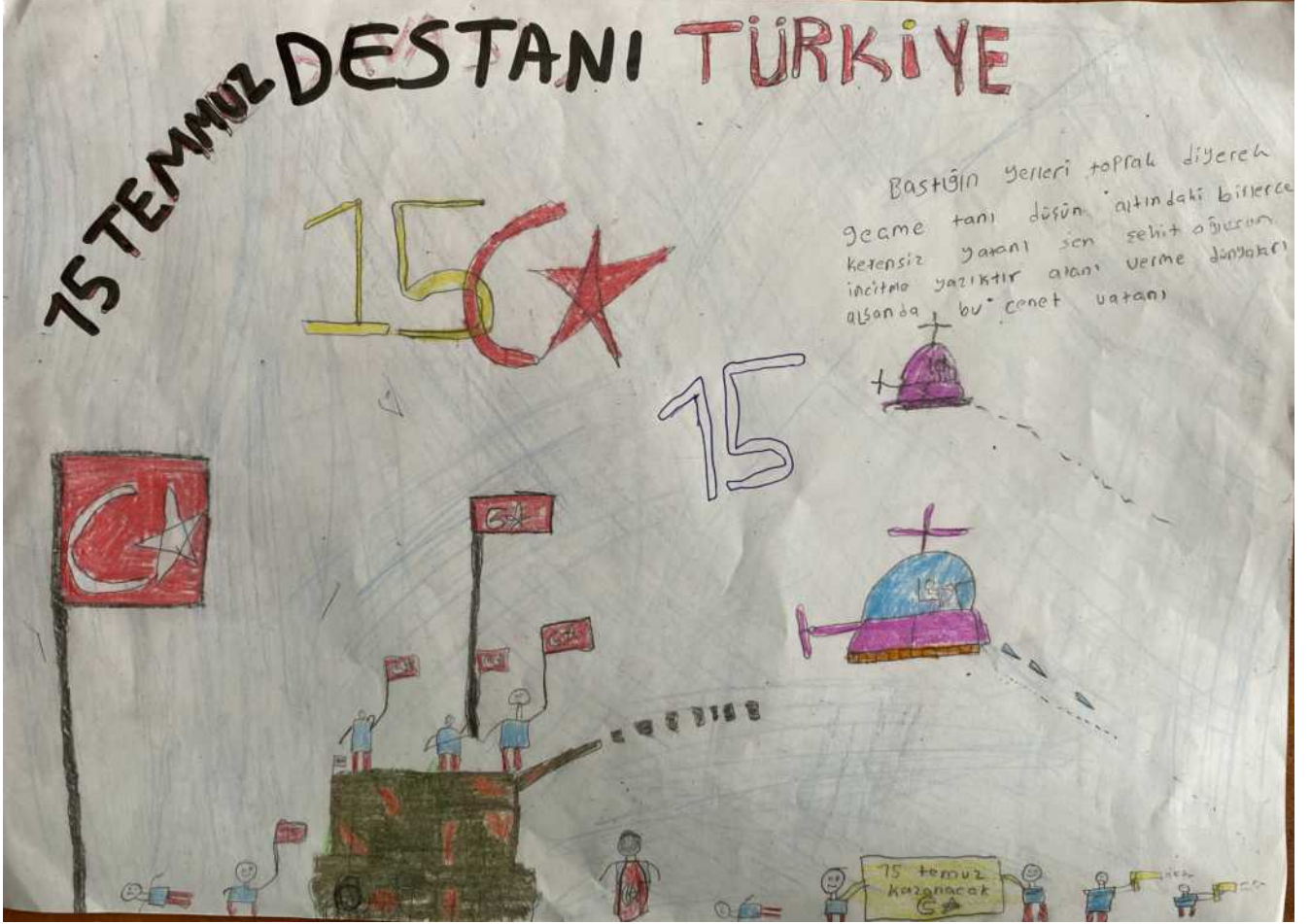
İdris DEMİR 7/B