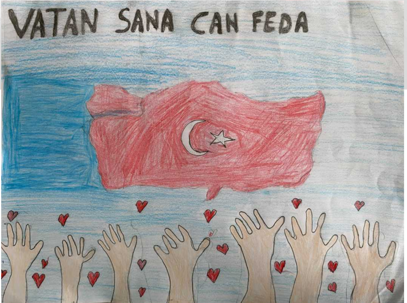
İbrahim DEMİR 7/A

*Bir ulusun bağımsız ve egemen olarak üzerinde yaşadığı yeryüzü parçası ve onun havası ile karasularına vatan denir. Bir kimsenin doğup büyüdüğü; bir milletin hâkim olarak üzerinde yaşadığı barındığı, gerekirse uğruna canını vereceği toprak. Bir kimsenin yerleştiği yere de vatan denir.