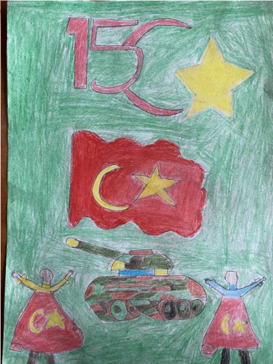
Hatice DEMİR 8/A