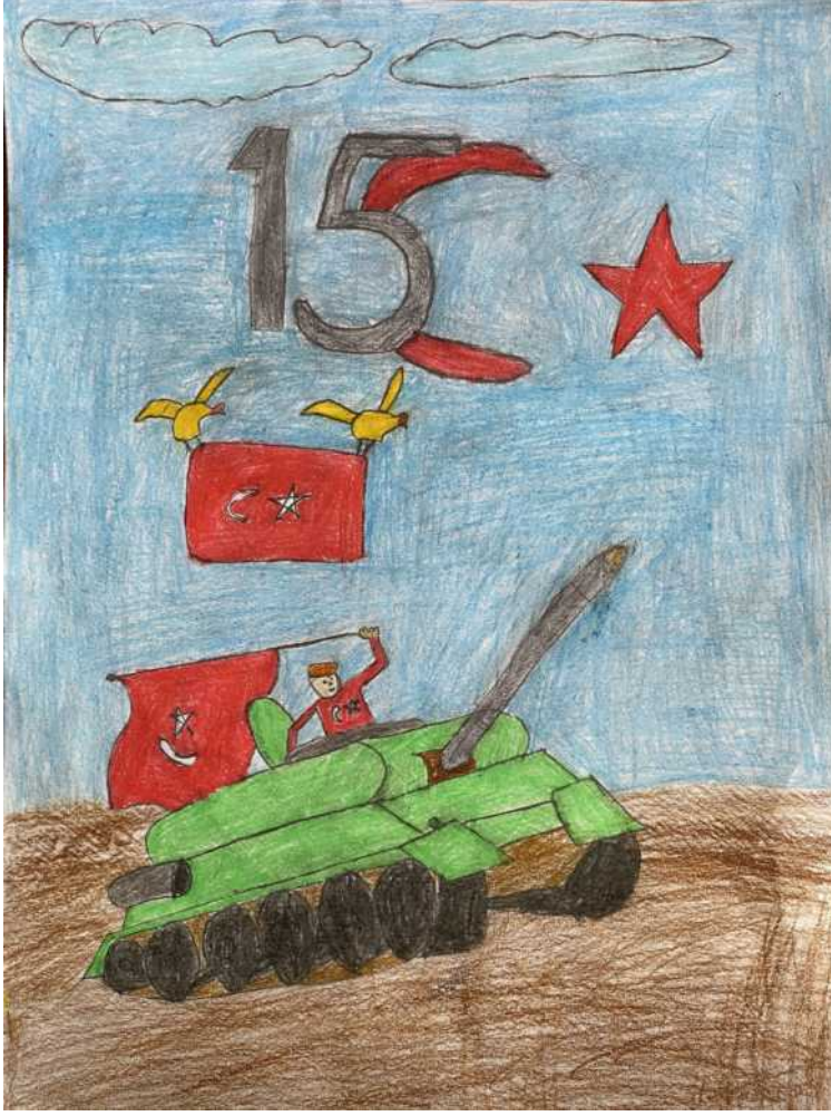
İbrahim Halil Çiftçi 8/A