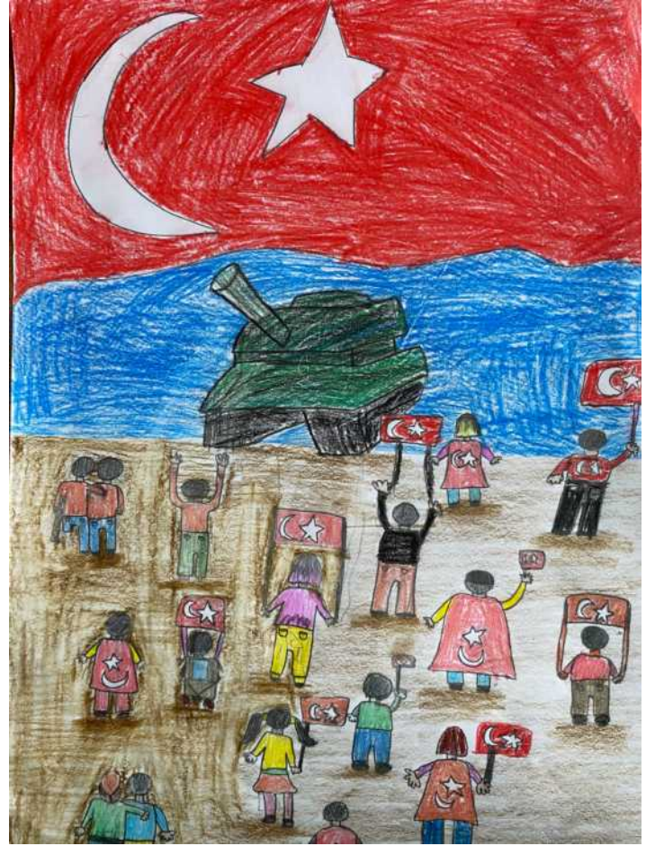
Gülbahar DEMİR 7/A