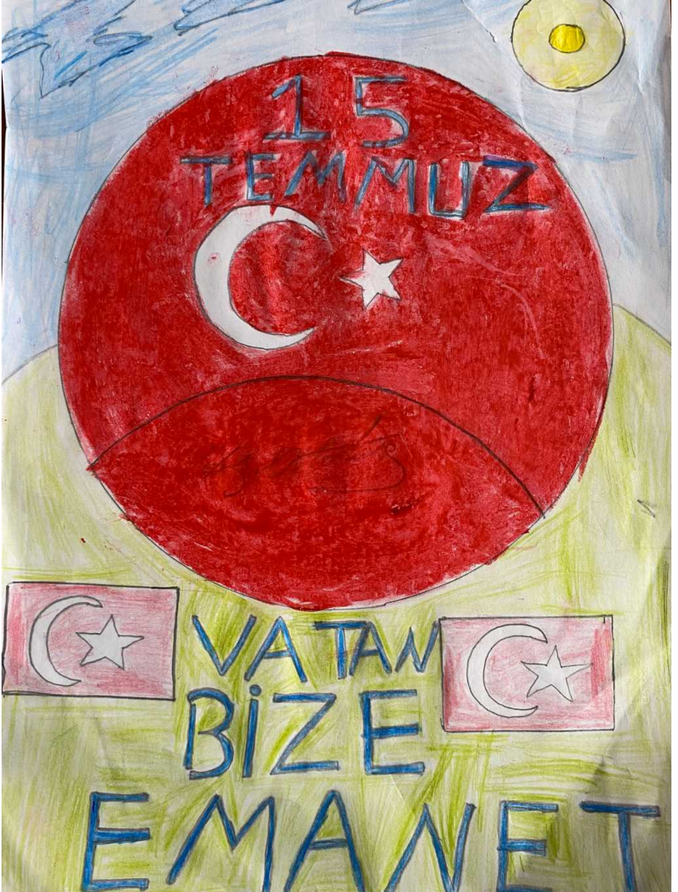
Esma Nur DEMİR 7/A